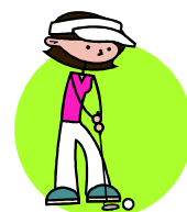
表 彰 ・個人賞（1位、2位、3位、4位、5位） ・町内別団体賞（1位、2位、3位） ・ホールインワン賞、参加賞

競技方法 ・2ラウンド（18ホール）の合計打数で競う ・団体戦は各町内上位5名の平均打数で競う