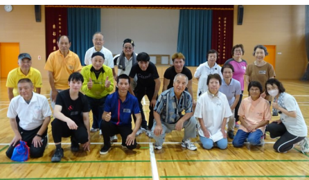
9/2 国際交流つなひろ 「ディスコン」