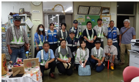
8/25 全市一斉パトロール