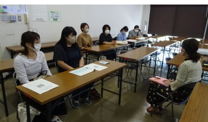
9/9 家庭教育学級オンライン視聴会 「法的視点から見る子どものSNS被害」