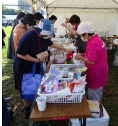
JA北九女性部が出店