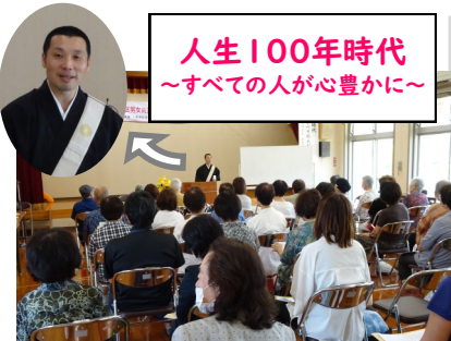
人生100年時代 ～すべての人が心豊かに～