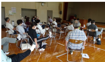
9/9 市民講座 「ウォーキング講話」