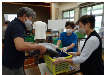
9/5 市民講座 「コンポストに挑戦」