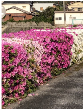
センター敷地内に咲くつつじ