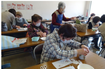
3/3 市民講座 「ポーセラーツ・血作り」