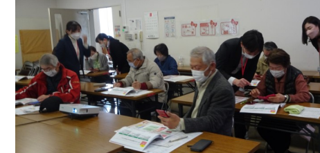
3/7 市民講座 「スマホ講座」