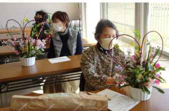
2/14 市民講座 「バレンタイン フラワーアレンジメント」