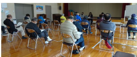
2/15 クラブ登録説明会 コロナ禍の為、2回に分けて行いました。